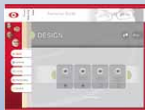
Valg af glastypepe

Det positionerer din virksomhed som nyskabende og moderne og hjælper dig med at udvikle virksomheden yderligere og forstærke dine kunderelationer.