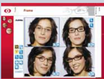
Valg af stel

Alle målinger som angives er afgørende for, at de ordinerede glas bliver korrekt produceret. Eystation er et multifunktionelt instrument som dels hjælper dine kunder med stelvalg og desuden, helt objektivt, måler alle nødvendige parametre for alle glas på markedet! Den bygger på den seneste generations teknologi, som giver et helt nøjagtigt resultat og derfor en optimal komfort til dine kunder. Eystation er udviklet i et samarbejde imellem BBGR og Activisu og drager fordele af ikke mindre end 3 nye patenter.