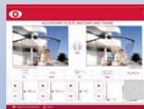
Demonstration af progressive glas